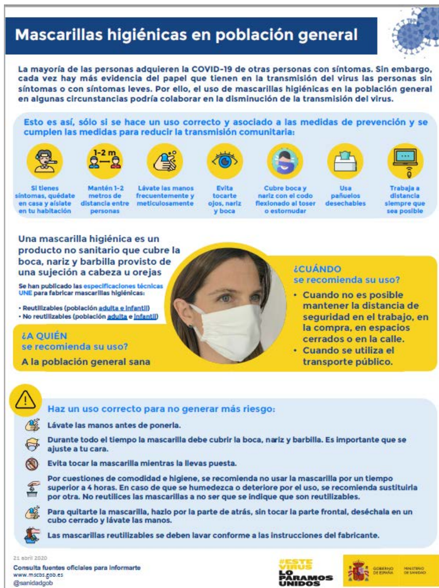
Mascarillas higiénicas en población general (Ministerio de Sanidad, 2020)

Nota: las mascarillas quirúrgicas y las mascarillas higiénicas no son consideradas EPI.